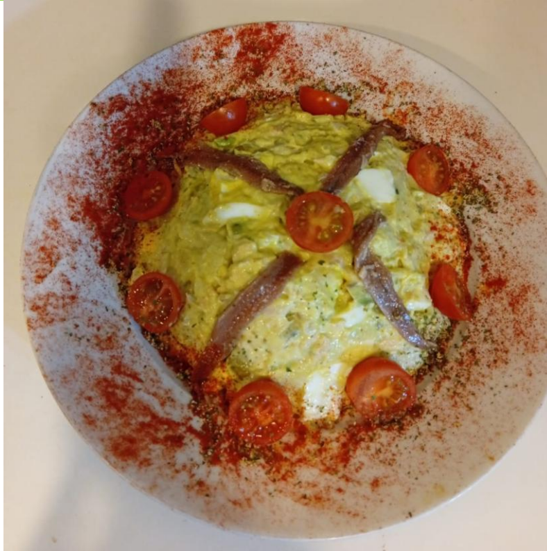
Ensalada de rape, patatas y langostinos

Los ingredientes van cocidos y picados, pero no en tamaño muy pequeño, es decir, que se note un poco la mordida para sacar gusto a los ingredientes. El rape pueden ser colitas, bien fresco o congelado y los langostinos lo mismo. La mayonesa se hace en casa con el brazo moedor. Adornamos con unas anchoas y tomate y ya tenemos un plato sencillo y gustoso.