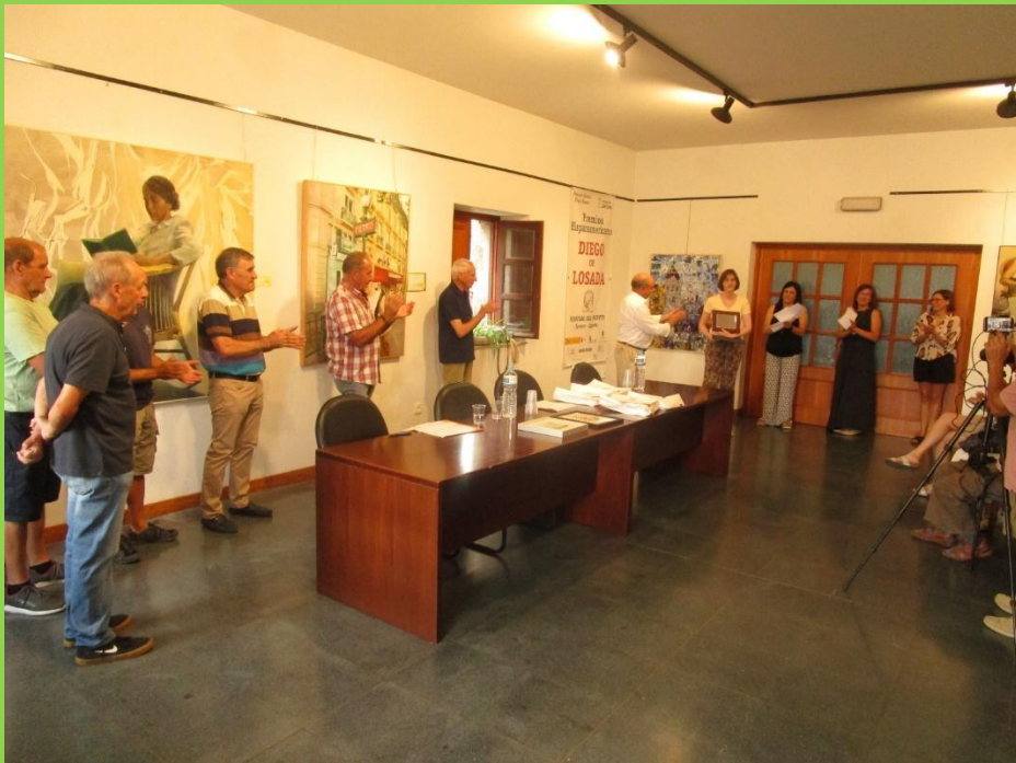
Entrega de los Premios Diego de Losada 2025

La Asociación Diego de Losada, había convocado estos premios en el mes de abril de 2025. El premio de Poesía llegaba este año a la 44 edición, mientras que el de Pintura cumplía 36 ediciones. En cuanto al premio de Fotografía, son ya 34 ediciones. La entrega de premios se celebró el domingo 18 de agosto de 2025, en el Palacio de Losada.