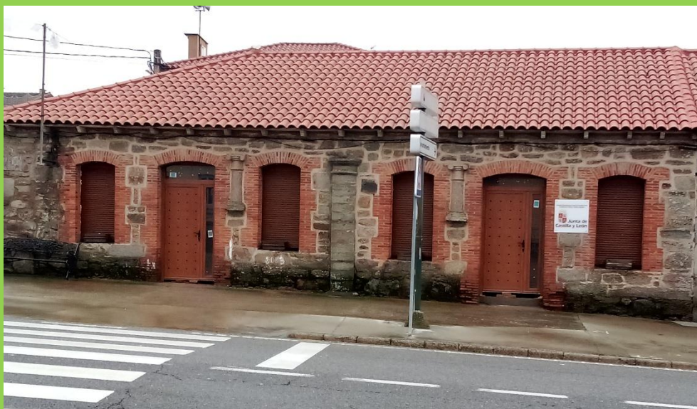
Edificio Casa de la Virgen, propiedad de la Cofradía de los Falifos que será la sede del Centro de Interpretación del Camino de Santiago Mozárabe Sanabrés.

Se está reformando el interior de la llamada Casa de la Virgen, que se encuentra junto al Santuario y al albergue de peregrinos, gracias a la colaboración de la Consejería de Cultura, Turismo y Deporte que ha aportado más de 80.000 euros a la Asociación de Amigos del Camino de Santiago Mozárabe Sanabrés para la “Segunda fase del proyecto de impulso turístico de los caminos de Santiago de Castilla y León” . Este centro tiene una gran sala de exposiciones, una oficina con acceso independiente y también un aseo y otro aseo adaptado.